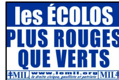
affiches (65x45 cm) : 5 x =