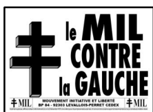
affiches (65x45 cm) : 5 x =

Le Mouvement Initiative et Liberté (MIL) lance régulièrement des campagnes militantes. Si vous souhaitez y participer activement, nous vous invitons à commander notre matériel de propagande par courrier. Nous vous fournirons en fonction de nos stocks disponibles. Vous devez nous indiquer les thèmes, les quantités et l'adresse de livraison (par multiples de 5 affiches).