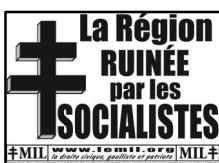
affiches (65x45 cm) : 5 x =