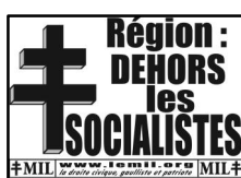
affiches (65x45 cm) : 5 x =