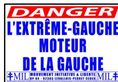
affiches (65x45 cm) : 5 x =